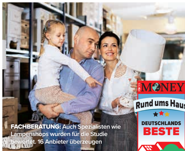
FACHBERATUNG: Auch Spezialisten wie Lampenshops wurden für die Studie bewertet. 16 Anbieter überzeugen

Mittelwerte, gemundet; Quelle: ServiceValue